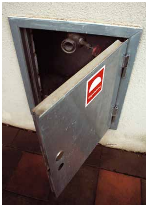
I stigarledningen i luckan på fasaden kan räddningstjänsten koppla in vatten. Inne i trapphuset finns sedan uttag där slangar kan anslutas.

I trapphus utgörs brandventilationen ibland av vanliga öppningsbara fönster. Det är viktigt att se till att lekande barn inte kan falla genom dessa. För att hindra olyckor kan exempelvis ett utvändigt galler användas.