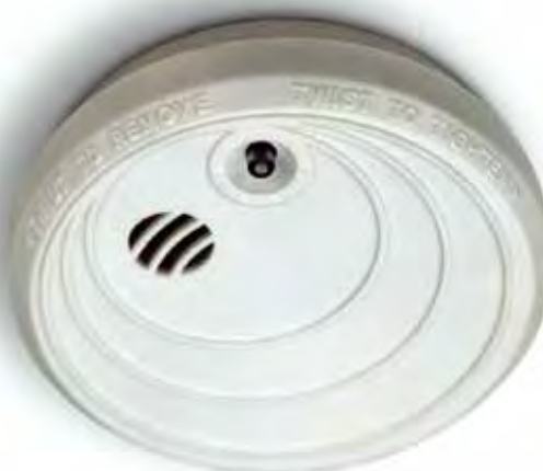
Det ska finnas minst en uppsatt och fungerande brandvarnare i varje lägenhet. Billigare liv- och egendomsförsäkring är svårt att hitta.

brandvarnare installeras, men att de boende sedan själva ansvarar för att regelbundet prova att den fungerar och byta batterier vid behov.